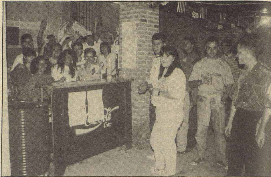
El grupo juvenil "La Bamba" participó muy activamente en el ambiente

L'estrella de dissabte fou la discoteca mòvil del grup "La Bamba"