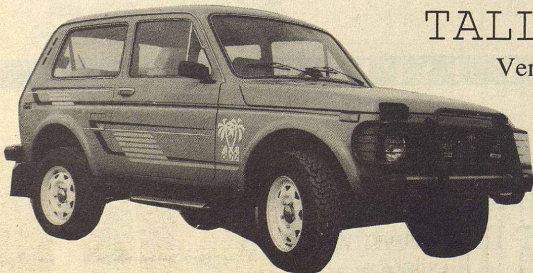
Todo Terreno 4x4 Lada Niva

"Pienso que ya está bien tal como está, incluso tienen un horario demasiado amplio. Comprendo que es un horario muy sacrificado, sobre todo por el hecho de abrir los sábados por la tarde".