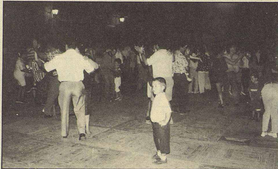
La Festa Major sempre ha sigut polèmica