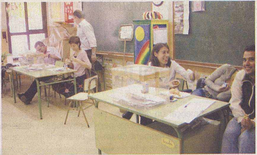
Els molletans seran cridats a les urnes per escollir el nou alcalde de la ciutat

Tot i que aquests projectes es durant a terme a curt termini, hi ha esdeveniments que tardaran una mica més a desenvolupar-se. Entre aquests trobem la urbanització del Pla de les Pruneres, on es construirà un pàrquing soterrani, i més a llarg termini, un teatre-auditori, ja que, segons l'alcalde de la ciutat: "Fa temps que les entitats culturals reclamen tenir un espai on desenvolupar de forma correcta i amb amplitud les seves activitats" . Altres projectes a llarg termini són la nova biblioteca central de la ciutat a la plaça Martí i Pol, la rehabilitació de les masies de Can Flequer, i la de Can Pantiquet, per ubicar-hi el Centre d'Estudis per la Democràcia amb el fons cedit per Jordi Solé i Tura, i altres documentacions del patrimoni històric de la ciutat (donacions particulars i institucionals).