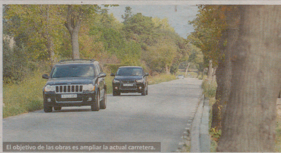
El objetivo de las obras es ampliar la actual carretera.