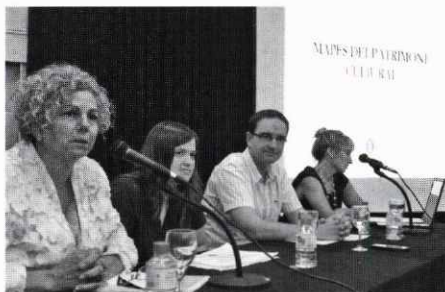
Presentació del Mapa del Patrimoni.

-Es va presentar al centre cívic La Fàbrica, el mapa del patrimoni, que és una feina exhaustiva i molt ben feta, amb un detall acurat del que representa el patrimoni cultural del poble i que es pot consultar a la pagina web de l'ajuntament.