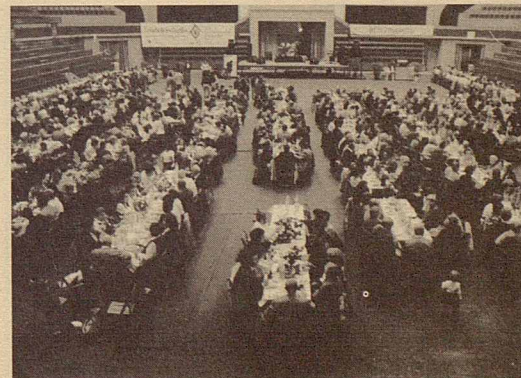
Trobada de les famílies