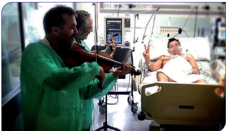
A l'Hospital, aquesta activitat té lloc a les Unitats de Cures Pal·liatives i de Cures Intensives

Cabré Junqueras presta els seus serveis a Granollers i al Vallès Oriental i manté una estreta col·laboració professional amb l'HGG.