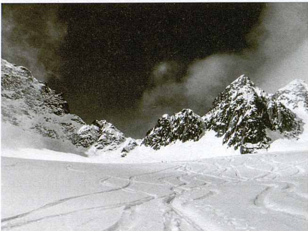
Al centre de la imatge la bretxa Brunnenstock de 3.092 m durant el segon dia de travessa.

El massís del Dammastock es troba als Alps Suïssos, a l'est de l'Oberland, on hi ha el naixement del riu Roine, molt a prop del Furkapass (un dels colls més importants de Suïssa entre els cantons de Valais i d'Uri). Per setmana santa del 2013 vam realitzar una ruta circular d'esquí de muntanya de 5 dies, però a causa del mal temps no es va poder acabar de completar.