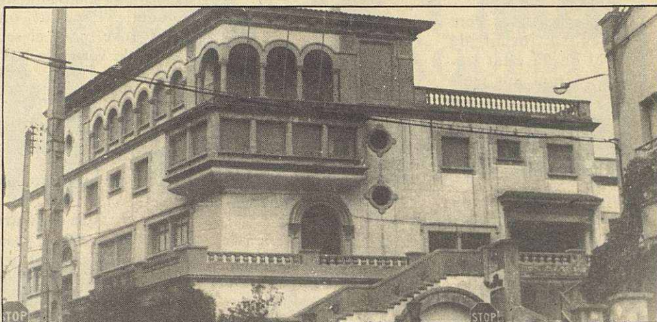
A los gallegos y andaluces podemos encontrarlos en Can Gomà

Noches flamencas, homenajes a la vejez, a Falla, a García Lorca, obras de teatro, conferencias, clases de baile..., ciertamente estos andaluces nos están «bombardeando» algrememente con lo más suyo. «El trabajo