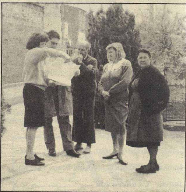
Los vecinos de La Casilla denunciaron la contaminación de sus pozos

Abril fue el mes en el que los vecinos del