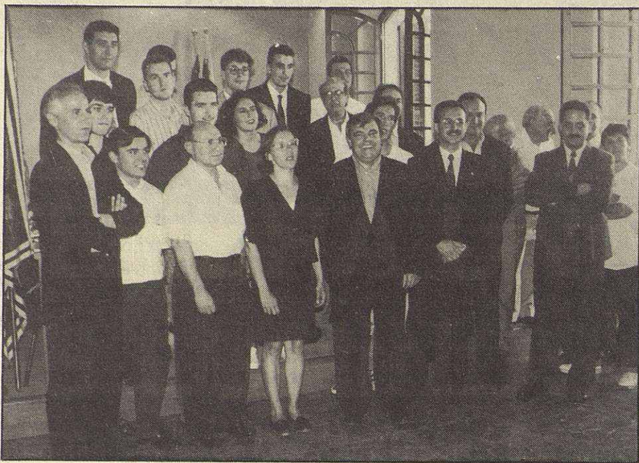
El C. B. Mollet logró un ansiado ascenso en su 50 aniversario

Este año que dentro de unos días dejamos atrás, será recordado por los molletenses por la visita que Sus Majestades los Reyes de España hicieron a Mollet del Vallès, el pasado tres de noviembre. Las muestras de afecto que recibieron los monarcas por parte de los molletenses, convirtieron al tres de noviembre en una fecha histórica.