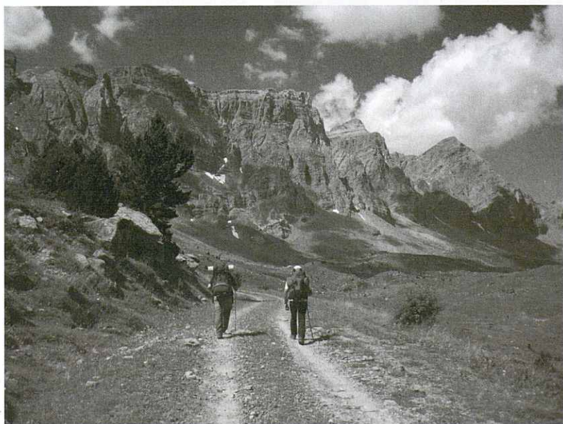
Serra de la Peña Telera.

El dia que fa vuit el volem dedicar a "descansar" una mica de la forta pallissa dels dos darrers dies. Sortim del mateix Formigal amb la intenció de pujar la Peña Foradada que representa una ascensió "curta". Però el dia és esplèndid i quan som al coll del Forato decidim