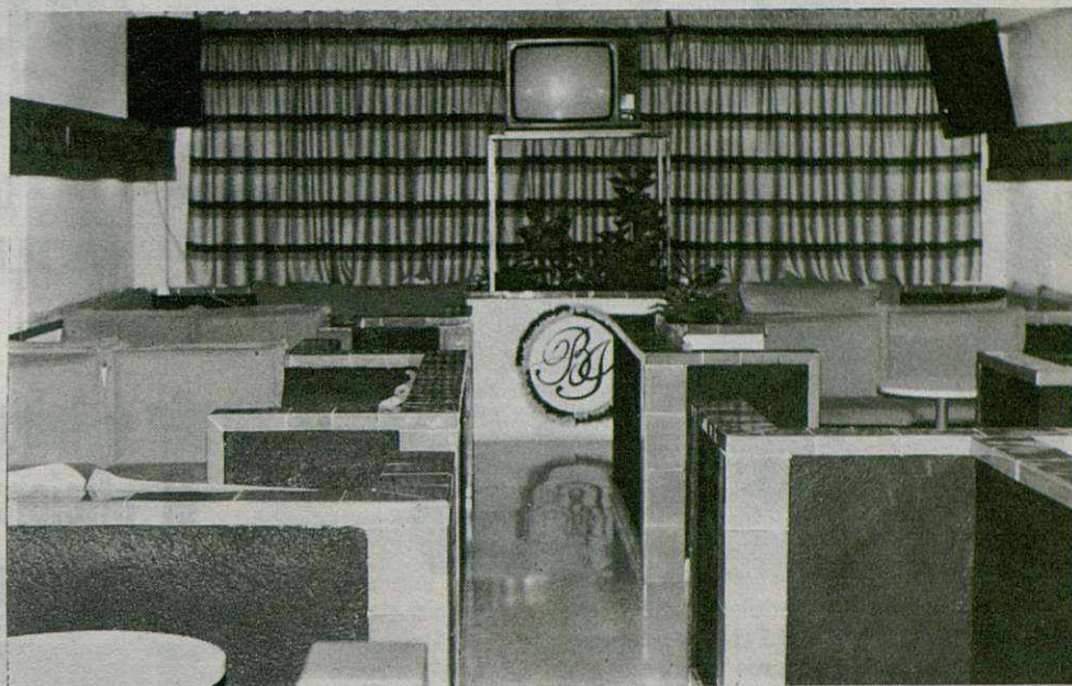
Cómodo Pub debidamente equipado con T.V. color y vídeo.

fecha, cuadro técnico y directivos de la en el restaurant-Pub-Cafetería situado en la D, 7 con el fin de celebrar una cena de despedida. o se las fotografías, reúne una serie de participantes de su corta vida, en uno de los más n. ciones definitiva una excelente velada en de placer, alegría y diversión. Al finalizar hubo muchos elogios a B.J., tanto por su es- lucida como por sus menús y completas instalaciones.