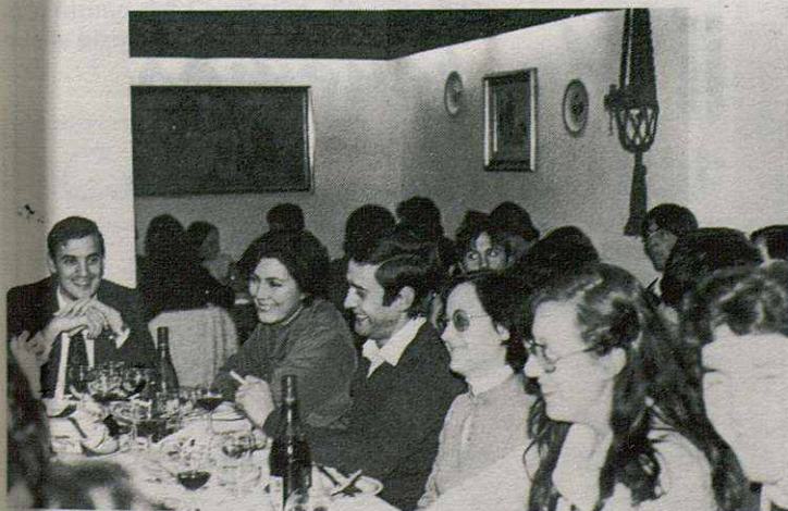
Este buen ambiente reinó en toda la velada.