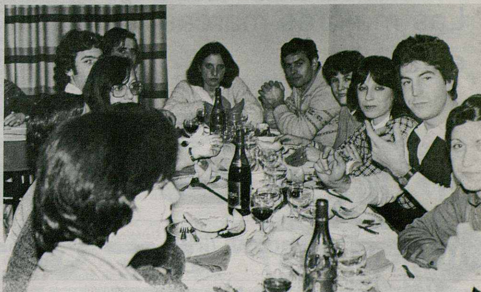
Presidente, entrenador y demás miembros de Tacones acompañados de sus esposas, hacen un alto en la comida y posan para nuestro fotógrafo.