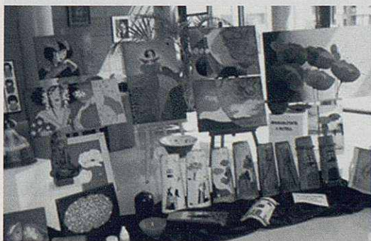
Detall de l'exposició de l'Altell.

Els joves, vibraren amb la moguda musical Basf-12 i el Skate Party.