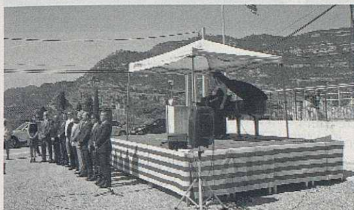
Hissada de la senyera a l'Onze de Setembre.

Un any més va tenir lloc la hissada de la senyera en el pati del Centre Cívic per part del govern municipal. Les associacions de Riells junt amb els regidors de l'ajuntament varen fer l'ofrena floral tradicional. A part de la diada institucional, també n'hi ha d'altres a títol particular i que fa molts anys que es fan, renovant la bandera de l'any anterior, com la del turó de les Onze Hores, o més recent la del Roc de Migdia, entre d'altres no tant a la vistes.