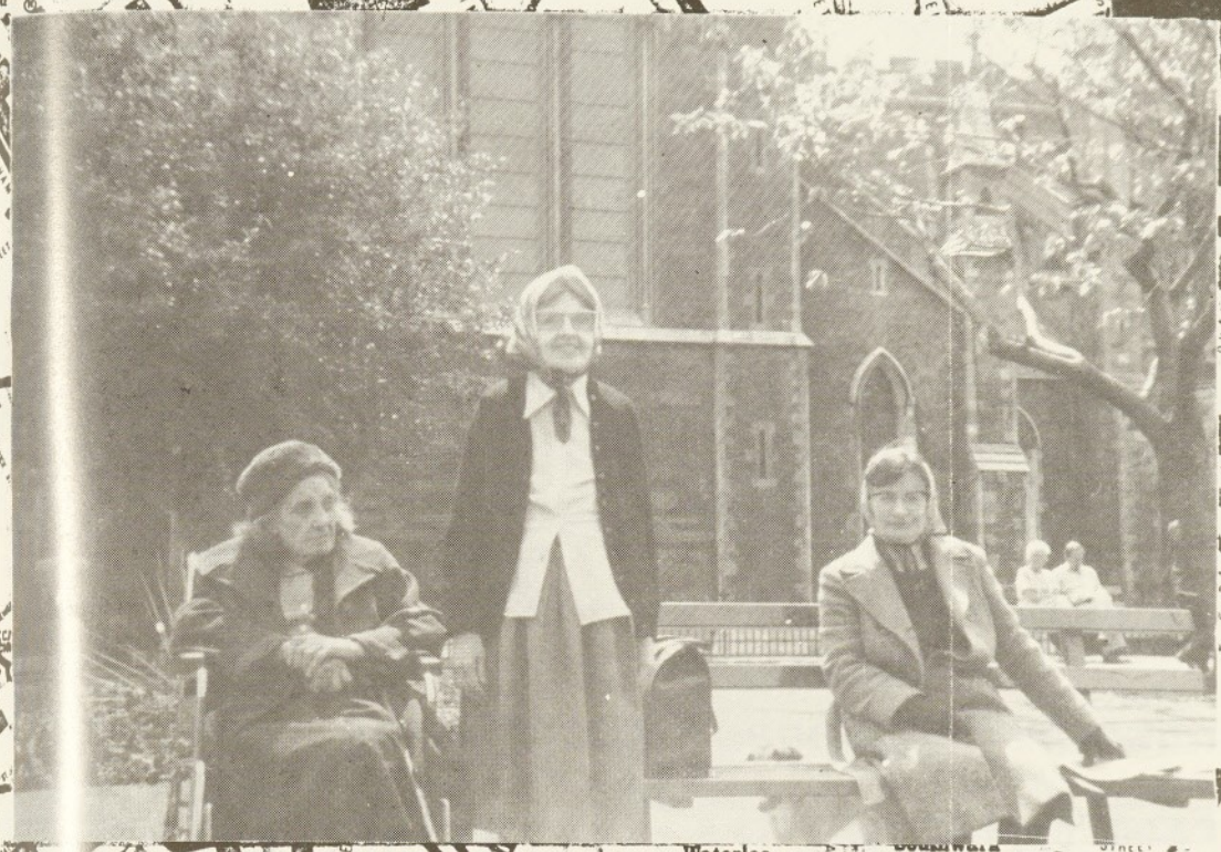
Tradicionalisme és un mot perfecta per al caràcter anglès