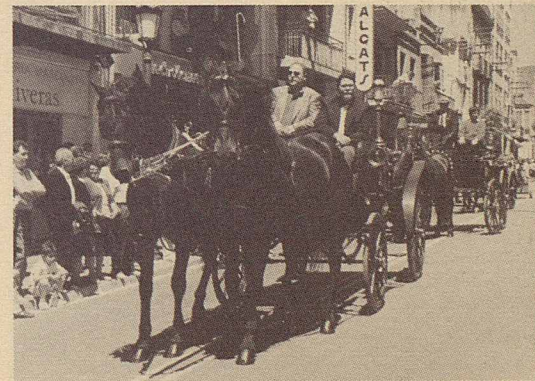
Desfilada de l'Ascensió