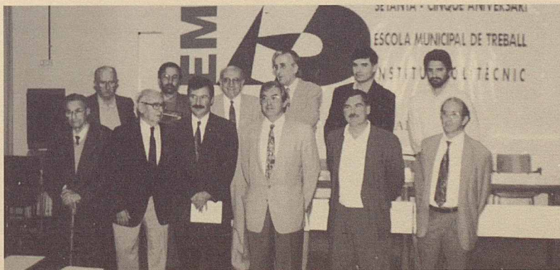
75è aniversari de l'Escola Municipal de Treball