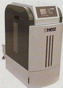
Caldera de biomassa automàtica