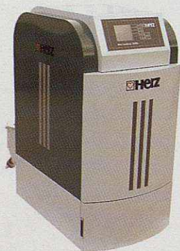
Caldera de biomassa automàtica