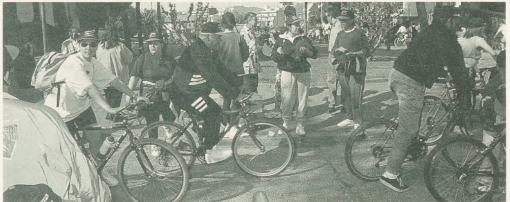
La Diada de la bicicleta va passar per l'Hospital.

Tots dos grups de ball van oferir al públic assistent uns quadres variats i alegres, que van fer les delícies de tothom. Un cop acabat el festival, es va oferir, a la pineda del centre geriàtric, un àpat a base de fino i tapes per a tots els assistents.