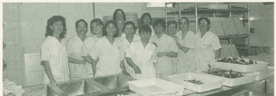
L'equip del servei de Restauració.

som responsables del benestar de cada una de les persones que treballen o han d'estar ingressades a l'Hospital. És per això que hem implantat un pla de neteja