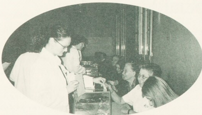
Gairebé el 61% dels professionals de l'Hospital van participar en les darreres eleccions sindicals.