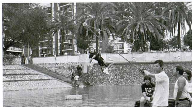
Parc d'Aventura. Activitats al Parc de Ponent durant la Festa Major de Granollers.

I era refrescant trobar-lo. Amb el seu somriure no exempt de timidesa. Amb la franquesa als ulls. Amb