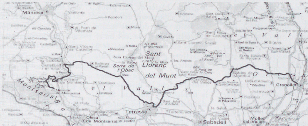
PERFIL TOPOGRÀFIC DE LA PUJADA A MONTSERRAT:

Si voleu participar amb algun dels tres grups aviseu a la gent de la junta per saber quants serem.