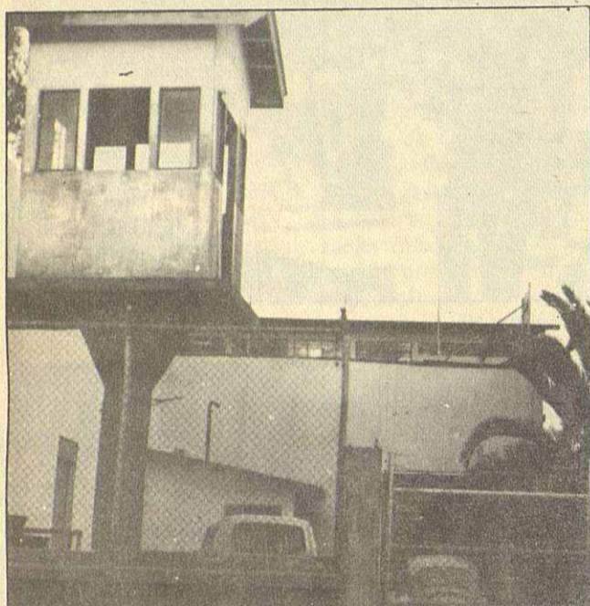
Exteriores de la cárcel de mujeres de Quito.