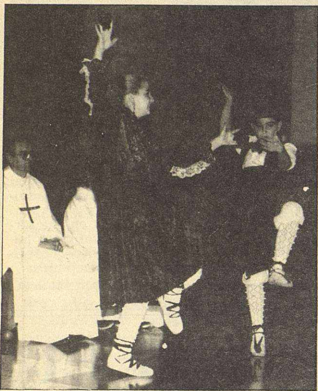
La misa baturra fue el acto central de la jornada

cabe, que el salón de actos del centro aragonés estaba totalmente lleno, no cabía ni un ápice.