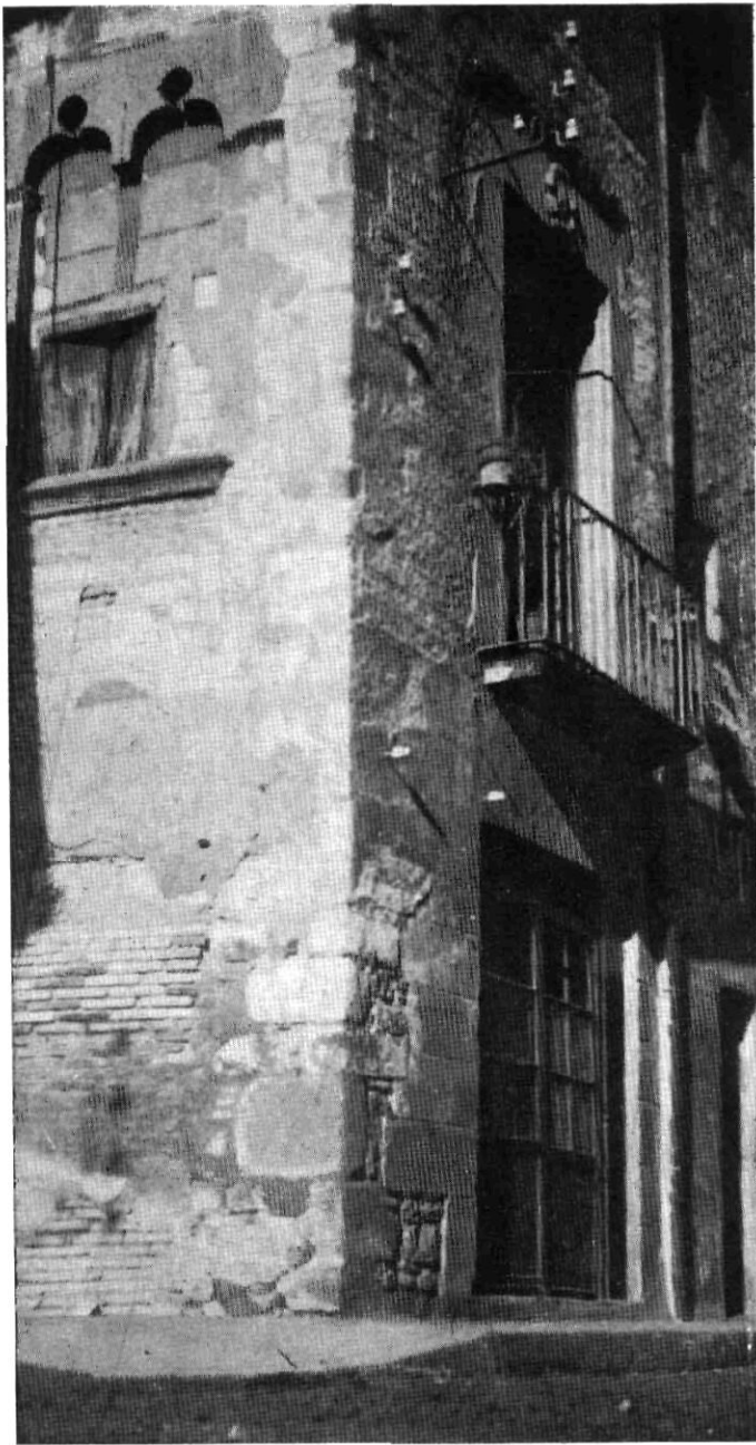
Un recó del Granollers antic al vell carrer de Barcelona.