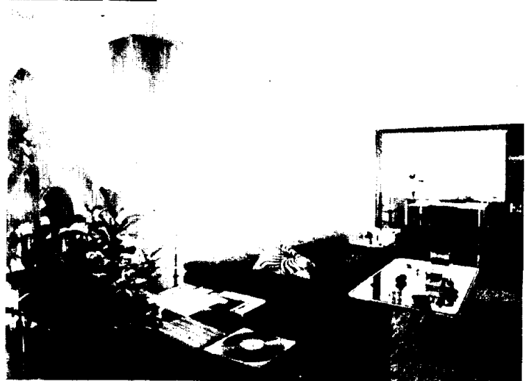
Zona de estar a nivel inferior, comunicado al comedor mediante puerta corrediza.