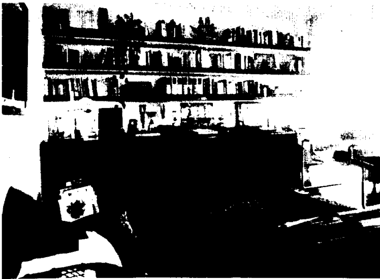
Zona biblioteca-lectura a nivel superior. Estantería de obra con sobre de madera y un sólo bloque inferior suspendido en la pared.