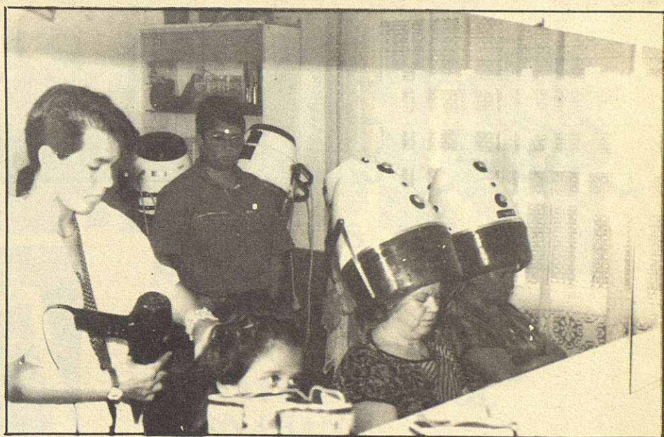
Actividades de la academia

Félix Ferran, 3 - Tel. 593 17 53 08100 MOLLET DEL VALLES