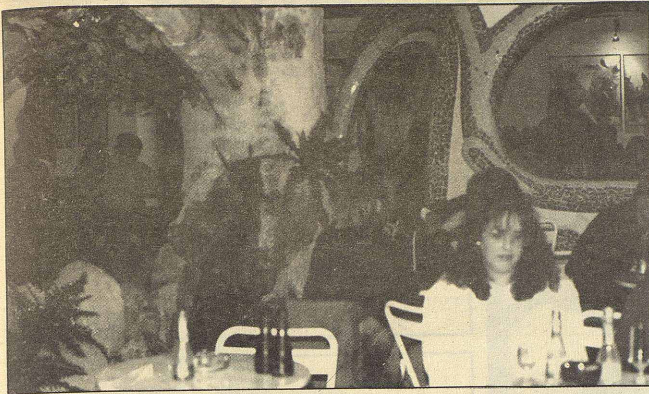
(Viene de la pág. anterior)