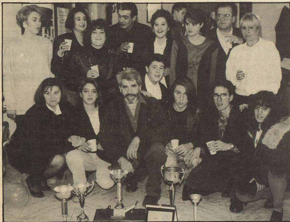
La Academia con sus trofeos de campeones de Europa

nos de estas academias. "De momento supone el estar en contacto con academias y universidades privadas punteras. También el poder hacer intercambio de alumnos con diferentes escuelas del sector. Y sobre todo, el poder obtener un título, reconocido a nivel europeo, de una profesión con un gran futuro".