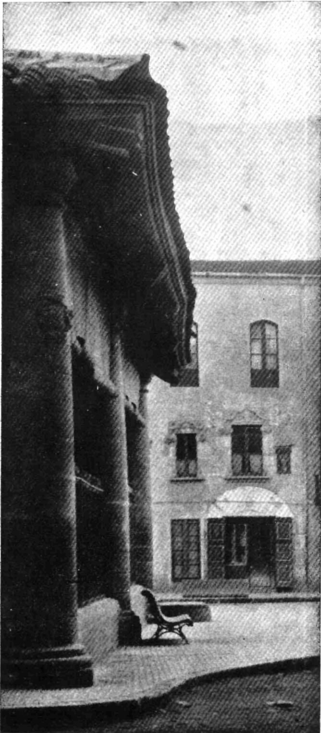
Això, que sembla l'atri d'un vell palau, és la Porxada.