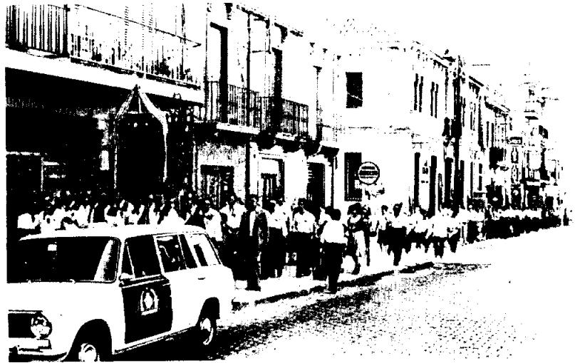
Desfilada de les Corals