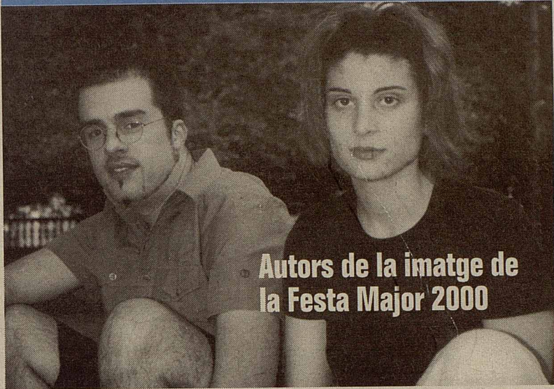
Autors de la imatge de la Festa Major 2000