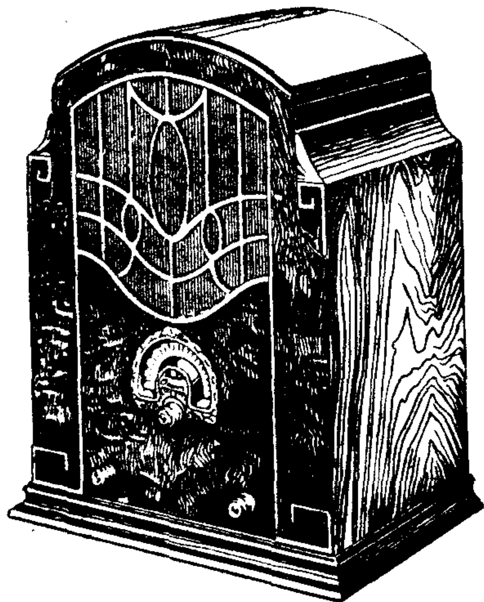
Model 80, de 7 vàlvules Pessetes 1075

Model 40 — Amb circuit Neutrodino ultra-modern a base de les vàlvules Multi-mu i Pentodo , dotat de tots els perfeccionaments i equipat amb el famós altaveu dinàmic TCA , amb 98 % de puresa de to.