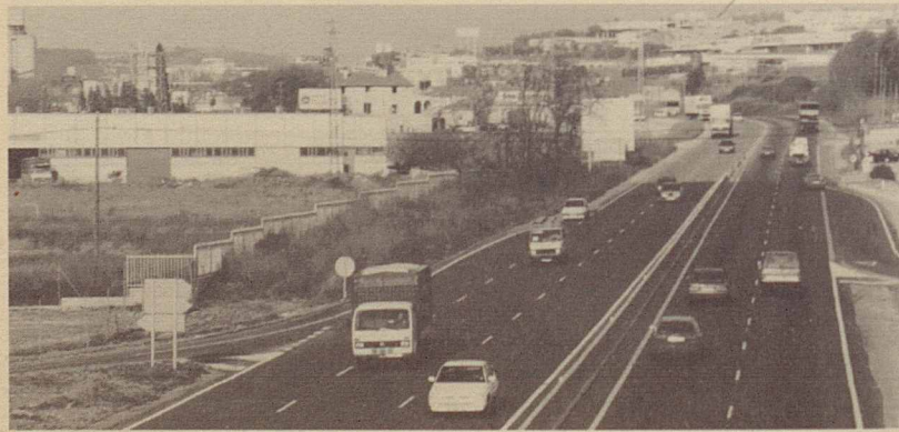
Nou servei de control de trànsit