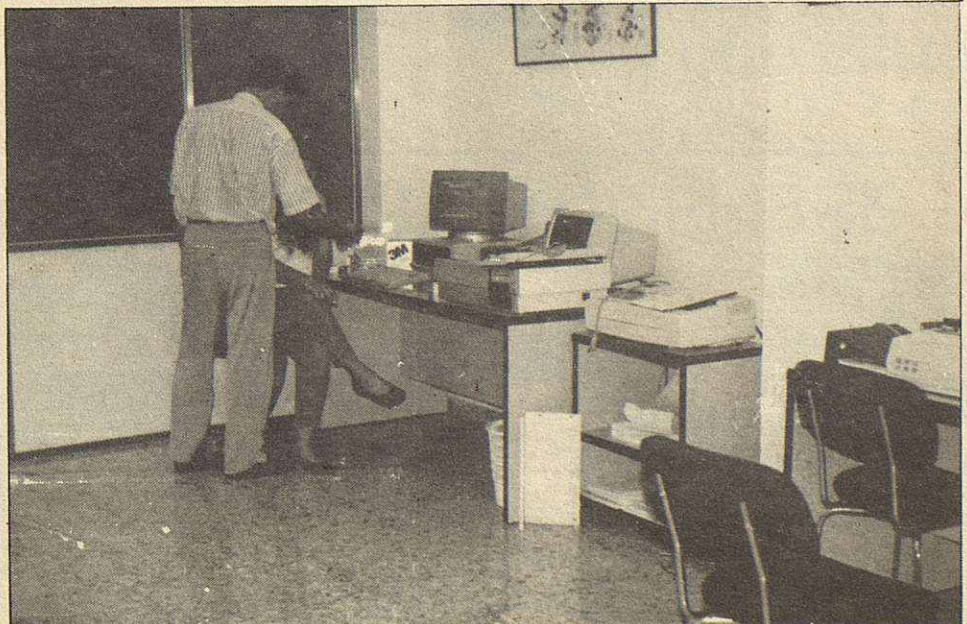
Una de las salas

ducto, cuánto queda en el almacén y cuánto se ha de reponer para que no se agoten las existencias ni se compre demasiado. Este control de ventas y este control del stock evita el clásico problema del comerciante que no sabe realmente y exactamente lo que tiene almacenado, o lo que es lo mismo, el dinero que tiene aparcado sin sacarle provecho. Implica, por supuesto, ahorrarse el salario de una persona que antes se tenía que ocupar exclusivamente del almacén, etc. etc.»