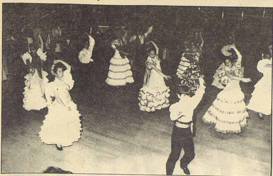
El cuadro de baile del «Centro Cultural Andaluz» en una de sus muchas actuaciones

nen algunas diferencias, fruto de la distinta estructura de las viviendas. Allí es frecuente reunirse varias familias en la casa de alguna que la tenga más amplia, cosa aquí muy difícil, dada la pequeñez de los pisos.»