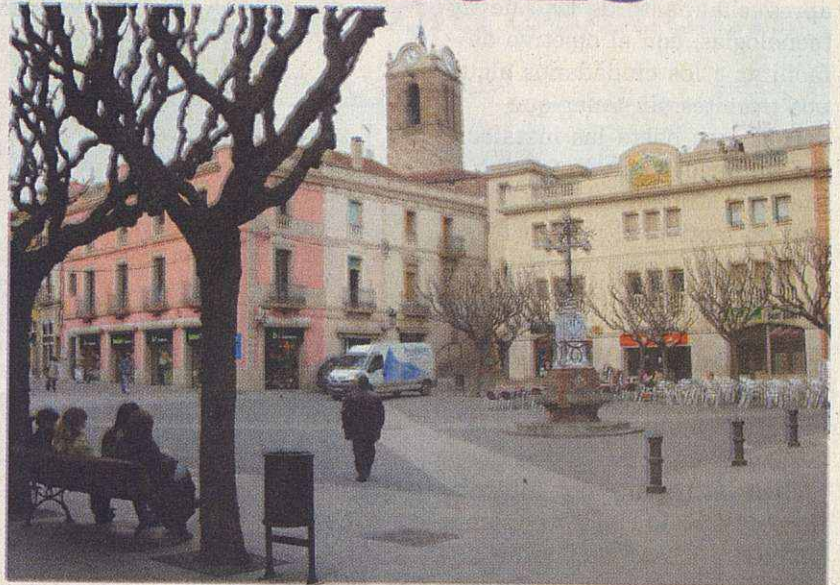
Un nuevo plan urbanístico continuará la transformación de Mollet

La evolución y el acceso a las nuevas tecnologías, el aumento de la población y su pluralidad, los nuevos modelos comerciales y de transporte, la mayor preocupación por el medio ambiente ó las nuevas demandas de servicios municipales, son