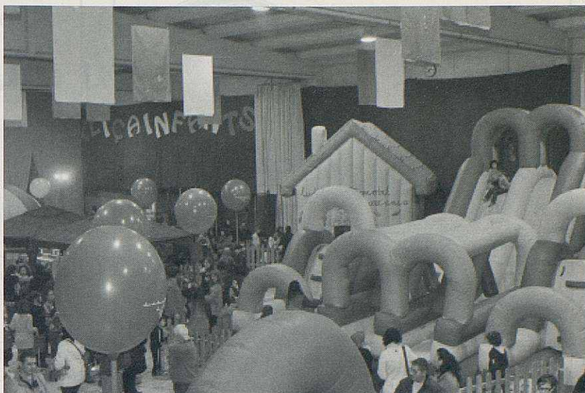
El local preparat pels Lliçainfants.

En coincidir amb el cap de setmana de la Marató de TV3 també es van fer un munt d'activitats: la comunitat educativa va portar a terme 'Enlairrem desitjos , on els nens posaven en un globus un desig i a la una del migdia els van llençar tots; l'associació de voluntaris van fer la venda de pastissos solidaris fets per gent del poble, cal destacar un grup de noies de l'IES del Vern que van col·laborar amb l'elaboració de cupcakes, la gent de l'ANC van fer el sorteig d'una panera. Tot van ser un bon nombre d'activitats que van ajudar a que novament la Marató fos un èxit.