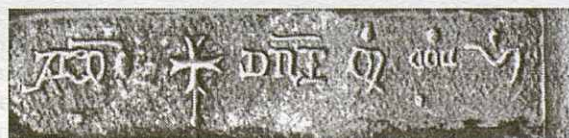
Inscripció a la porta de l'entrada: "Anno + Dni MCCCVI" (En l'any + del Senyor 1306)