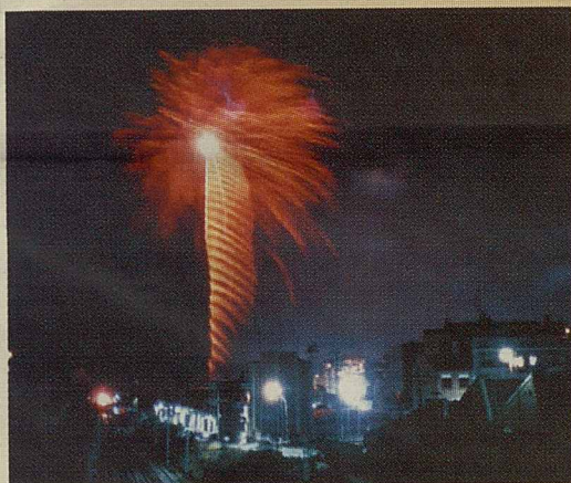
"Estirada de la corda" per: El Asqueroso Perico Grima

No oblideu, doncs que, per tancar la Festa Major 2004, el diumenge 29 a les 22.30 h al Parc Firal, podreu gaudir del Castell de Focs d'artifici a càrrec de Pirotècnia Turis.