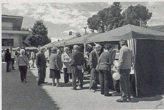
Les Botigues al carrer.

Relacionat amb aquest tema, la regidoria de Foment ha anunciat la voluntat d'organitzar un mercat setmanal