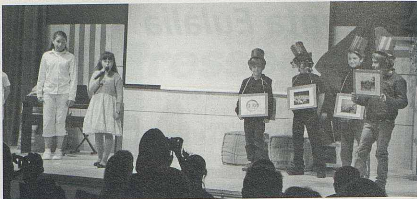
Alumnes de les escoles en la festa de Sant Jordi a la Biblioteca.

els dissabtes al matí. Es començaria a celebrar durant l'estiu i el lloc, als mateixos carrers de l'entorn de la Sala i al costat de la carretera.