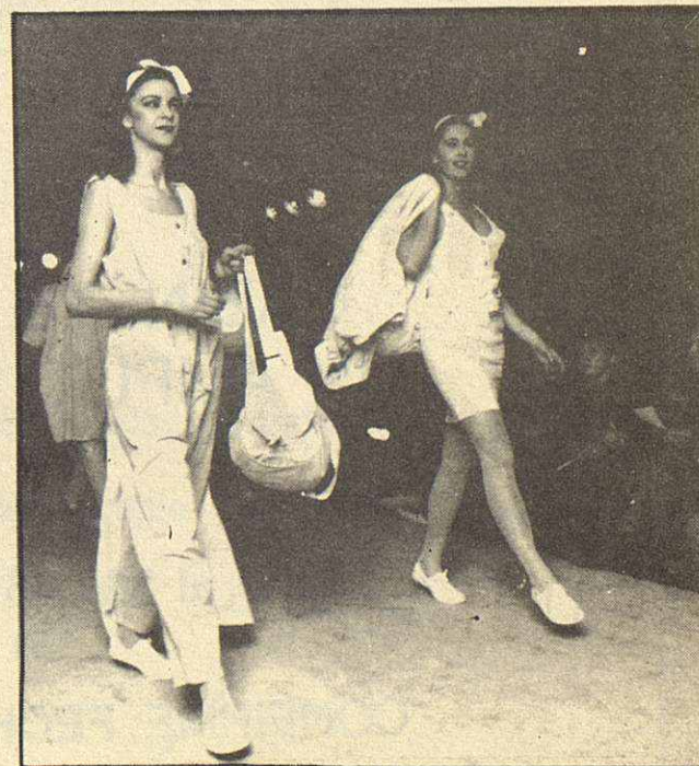
La moda JOANA en uno de sus desfiles por toda la geografía española

Por otra parte, un hecho quizá no tan material pero no por ello menos importante, es el grado de prestigio que supone para Mollet que su nombre conste día a día y de una forma continuada en todos los pabellones de moda. No olvidemos que el