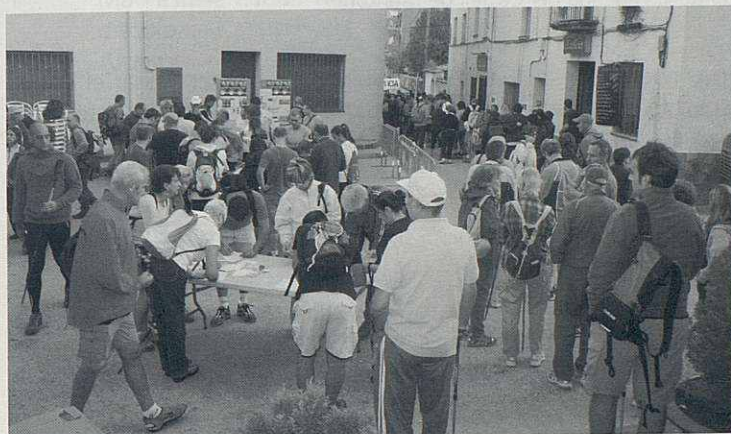
L'hora de la inscripció i la de la Marxa Passeig.