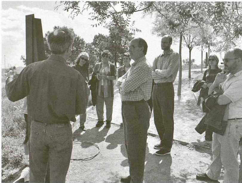
Moment en el que el Regidor d'urbanisme explica als presents els detalls de les espitlleres.

Els monuments foren inaugurats per l'Alcalde de Granollers i el regidor d'urbanisme, amb la presència dels mitjans de comunicació i de membres de la nostra entitat.