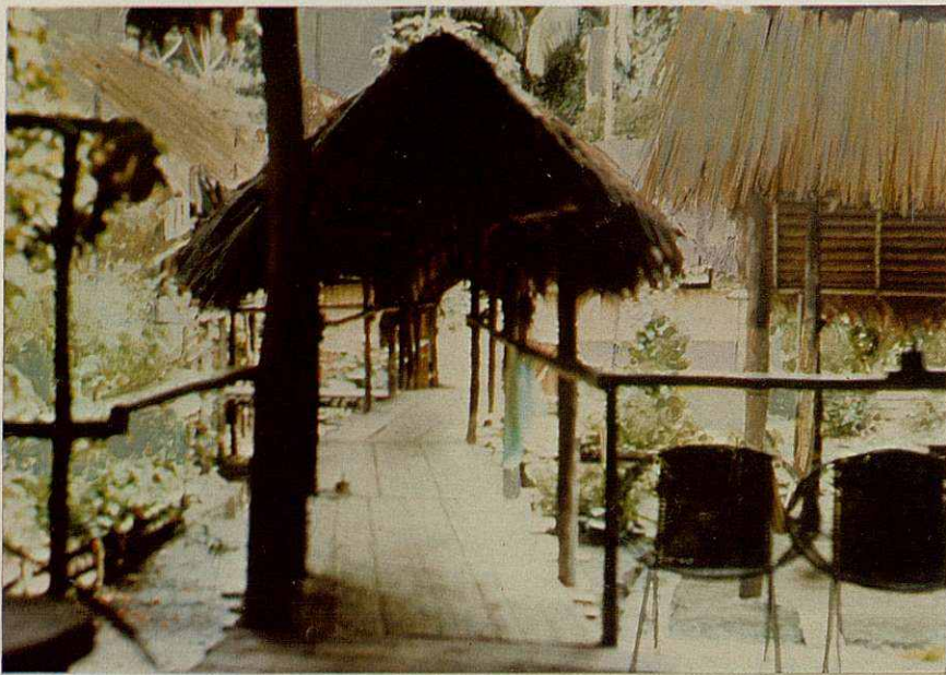
El corredor d'Explorama Lodge, d'aspecte ben inofensiu de dia, es torna sinistre durant la nit enllumenada amb petroli.