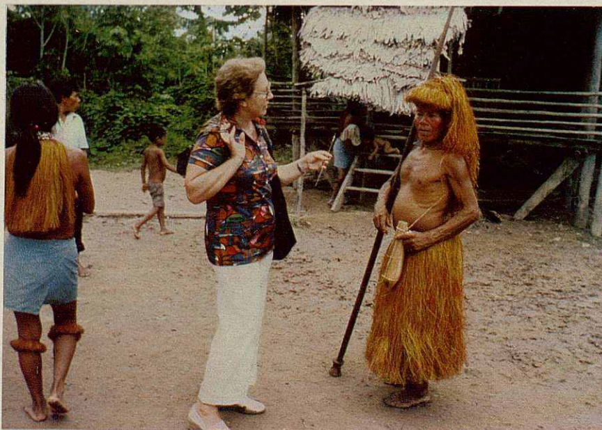
La muller observa atentament els detalls que presenta una sageta yagua.