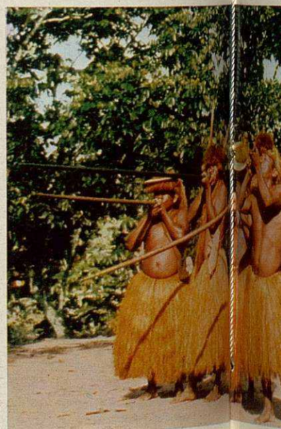
Els yaguas es complauen en disfressar-se al màxim perquè els tòrrids i sissims turistes que venen per la barbana es...