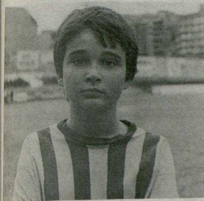
CLAPE, excelente y rápido extremo del Alevín "A" del C. F. Parets

Entre varios de los chavales que apuntan buenas cualidades, hemos elegido a CLAPE, extremo izquierdo nato, que con una gran dosis de voluntad se está recuperando de una pasada lesión en un brazo, y que con sus rápidas internadas lleva siempre el peligro al marco contrario.