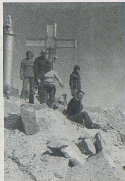
Al cim de l'Aneto.

Quan tornàvem d'Escandinàvia es va fer de nit poc abans d'entrar a França i vam parar la tenda a la sortida d'un poble, en un lloc molt tranquil. Després varem veure que estàvem al costat del cementiri. En el viatge en tren del Caire a Luxor, en una parada a l'estació d'un poble, uns infants varen començar a tirar pedres fins a trencar els vidres del compartiment del vagó. A Abu Simbel feia una calor de 48 graus i ens varem refugiar sota una acàcia. A Xile varem veure la Cruz del Sur a