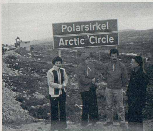
Al cercle Polar Artic.