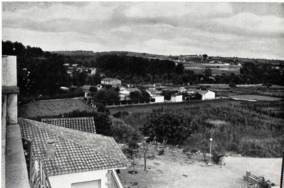
Vista del paraje «La Riereta» en el barrio de El Rieral.

(Continuación de la serie iniciada el año 1965)