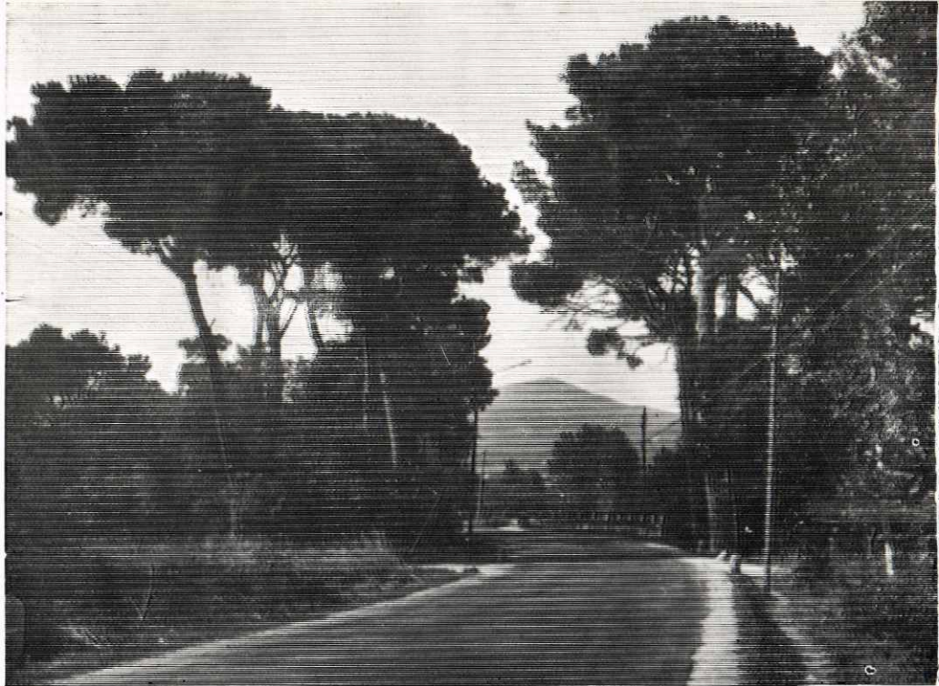
Vista de la carretera de Barcelona a su paso sobre el llamado «Torrent de can Burgués».