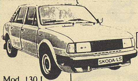
Mod. 130 L